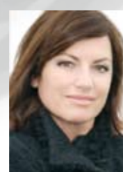
Christine Neubauer, Schauspielerin