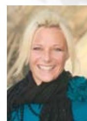
Claudia Nystad, Doppel-Olympiasiegerin