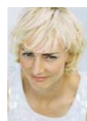
Heike Drechsler, Doppel-Olympiasiegerin